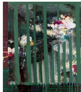
Closing Time, 2011, Acrylic on canvas 160 x 140 cm, 63 x 55.1 in.