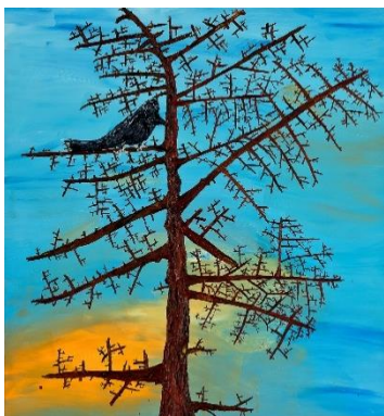
Bird, 2022, Oil on canvas 152 x 142 cm, 59.8 x 55.9 in.

Gana Art is pleased to present Floating Truth , a group exhibition featuring works by Nicole Dyer (b. 1991); Betty Tompkins (b. 1945); Hyungji Park (b. 1977); yoohee (b. 1991); and Jooyoung Lee (b. 1990). The exhibition highlights distinctive visual languages and artistic practices of the five contemporary female artists who capture the moment of truth, as it floats up to the surface in our everyday lives. Dyer, who had her first solo exhibition in Asia at Gana Art Sounds in 2021, speaks about the ephemerality of human life through her still-life paintings. Tompkins, one of the key figures in feminist art in the US, provokes questions about female identity by placing words or phrases about women submitted by anonymous contributors over images that are evocative of objectified women. Park reveals her traces of 'failures' that inevitably occur during the working process, allowing the viewer to look beyond the work as a finished product; while yoohee creates scenes that are both familiar and unfamiliar and suggests that we look at our ordinary lives from various perspectives. Lastly, Lee explores the nature of language and our passive perception, questioning how it gets distorted or loses transparency after it leaves the mouth of a speaker. Through the lenses of the five artists, Gana Art hopes that the exhibition will provide an opportunity for the audience to search for a truth hidden beneath the surface with fresh eyes.