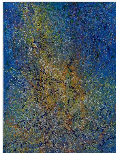
Hwang HoSup, Untitled, 2006, Acrylic on canvas, 230 x 174 cm