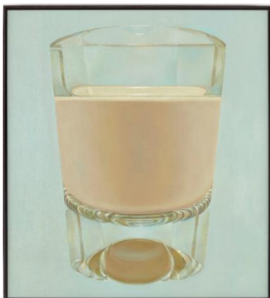
Milk (liquids #25), 2022, Oil on canvas, 110 x 100 cm, 43.3 x 39.4 in.

Gana Art is delighted to announce the presentation of always looking for a new balance , the first solo exhibition in Asia by Berlin-based artist René Wirths (b. 1967). In this exhibition, Wirths passionately explores how we understand information, questioning common ideas and images we see in the media. He takes on the role of a careful observer, capturing the essence of objects and turning his observations into paintings inspired by phenomenological principles. This is not only Wirth's solo exhibition with Gana Art but also in Asia. His approach transcends reliance on preconceptions when evaluating objects. As an observer of the world, the artist faces objects, remembers the impression of what he feels, and sublimates it into work. Unlike photorealism, Wirths' painting process does not rely on the aid of templates, photographs, or projectors, but purely as a transfer performance from three to two dimensions. As the title of this exhibition, always looking for a new balance , René Wirths aims to newly grasp the essence of objects that are considered fixed through continuous observation of everyday objects. Furthermore, his work questions us to consider how people perceive images in mass media, specifically, a phenomenon of recognizing them as realistic representations and actual objects in today's society. René Wirth opens up a significant discourse on the function and meaning of painting for those who live in a modern society where images are overflowing.