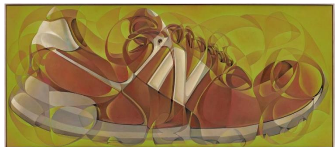
Sneaker, 2023, Oil on canvas, 110 x 250 cm, 43.3 x 98.4 in.